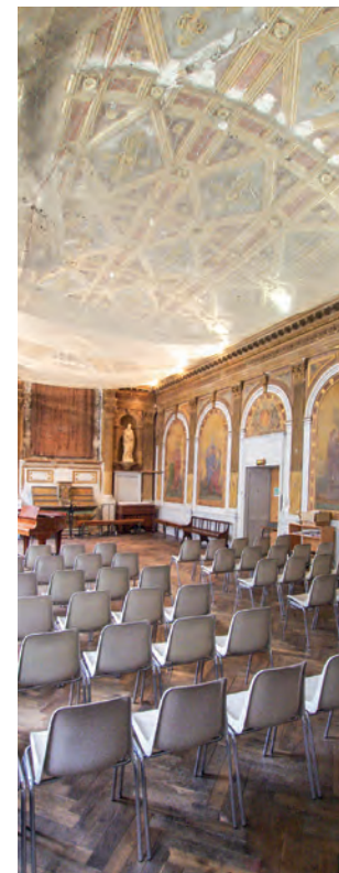
Chapelle des Jésuites

*consulter le site www.fondation-louis-cadic.fr pour plus de renseignements.