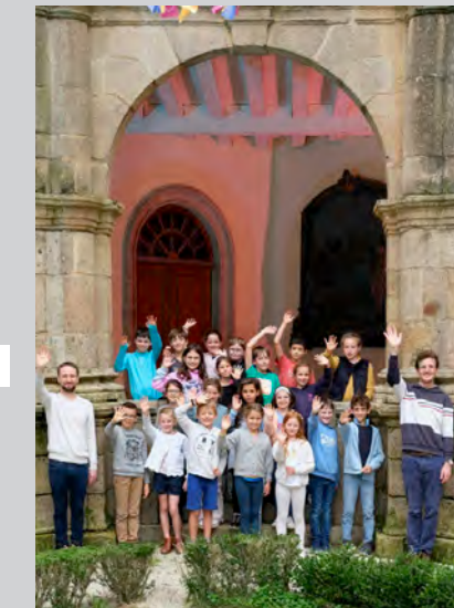
Pré-Maîtrise de Sainte-Anne-d'Auray