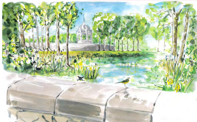
Bassin des Carmes, aquarelle de Magali Michel